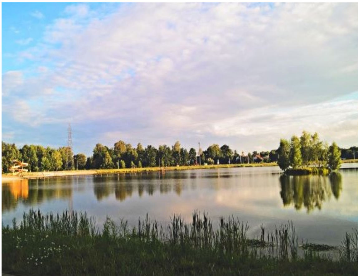
Fotografia – Zajew „Bojary” w Biłgoraju

stanu gospodarki odpadami komunalnymi w Gminie Miasto Biłgoraj za rok 2018